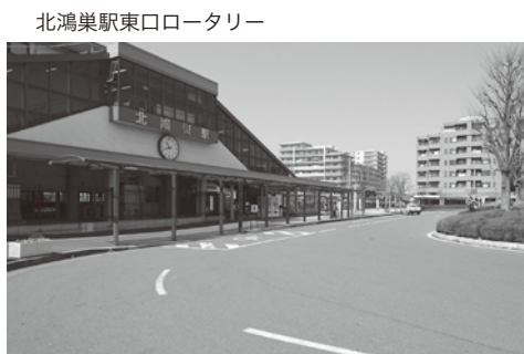
北鴻巣駅東口ロータリー

問 北鴻巣駅東口西口ロータリーは市の道路として認定され、駐車禁止重点地域に指定されています。