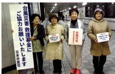
台風災害救援募金活動

誰もが安心して暮らせるようにすることが政治の役割だと思えます。憲法を生かし、くらし・福祉・教育の充実が最優先の市政となるよう引き続き全力をつくします。