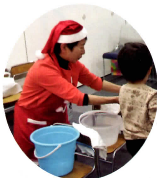
子育てフェスティバルに参加した「わくわくサロン」でボランティア