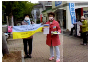
「ウクライナに平和を」と街頭から訴え