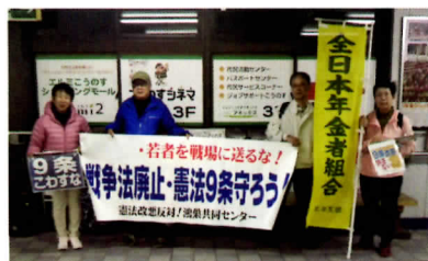
「若者を戦場に送るな」「9条守ろう」