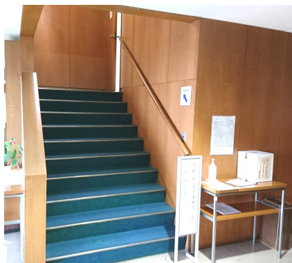
鴻巣市議会 本会議場 （本庁舎5階）傍聴席受付