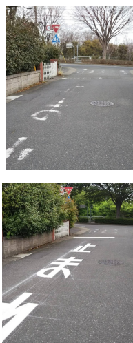
【右写真】近隣公園前・アペリア通り横の道路 (上) 消えた道路標示 (下) 工事完了

4月7日(日)に開催された自治会総会で「一時停止の道路標示が消えていて危険な箇所がある」というご意見が出されました。危険箇所の確認をし、市役所道路課に改善要望を行いました。5月に一部改善されました。