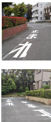
【右写真】赤見台3丁目・あかしや通り横の道路 (上) 工事完了 (下) 工事完了