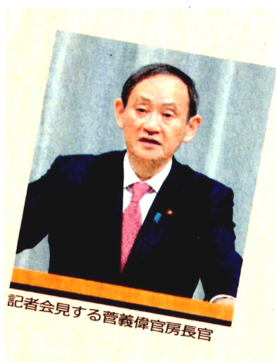
記者会見する菅義偉官房長官