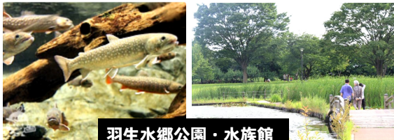
羽生水郷公園・水族館

地元では、自治会の皆さんが頑張られて、今年も「赤見祭 赤見台地区夏祭り」が赤見台近隣公園で開催されました。久しぶりに盆踊りも復活。孫たちとともにお祭りを楽しませていただきました。