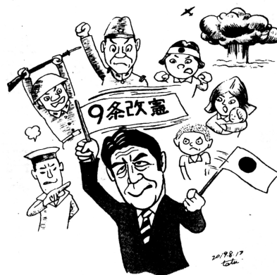
戦争犠牲者たちの怒りも知らないで...