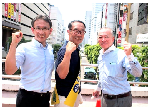
JR大宮駅大宣伝の大野もとひろ埼玉県知事選候補(中央)を応援する塩川鉄也衆議院議員(左)と伊藤岳参議院議員(右) = 8月17日

8月25日(日)投票日で行われる埼玉県知事選挙が熱い闘いを繰り広げられます。「1党1派のためではなく、県民のために政策を行います」と訴えています。福祉や子どもの教育、県民の安心・安全のために税金を使うことの重要性を強調する「大野もとひろ候補」を埼玉県知事に押し上げましょう。