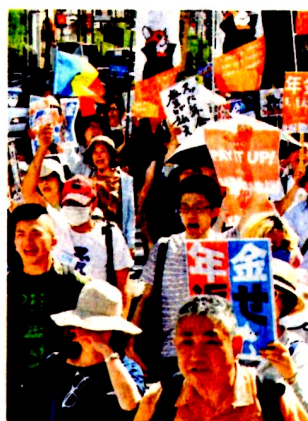
生活できる年金払えと通行人にアピールする人たち=6月16日、東京・銀座