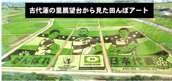
古代蓮の里展望台から見た田んぼアート

暑い暑い毎日が続いています。が赤旗読者の皆さん、いかがお過ごしでしょうか。私は、他県に住む小学校1年生と3年生の孫と密な1週間を過ごしました。行田の田んぼアート・羽生の水族館熊谷の映画館と他市の施設を見てきました。子どもたちと安全に過ごせて、埼玉が感じられる場所がもつとあるといいなと思います。