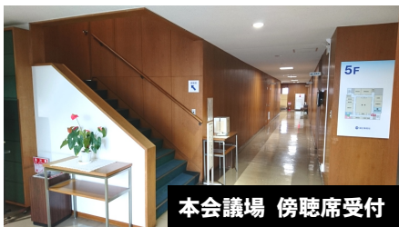
本会議場 傍聴席受付

ぜひ議会の傍聴にお出でください！鴻巣市ホームページから議会生中継もご覧になれます。