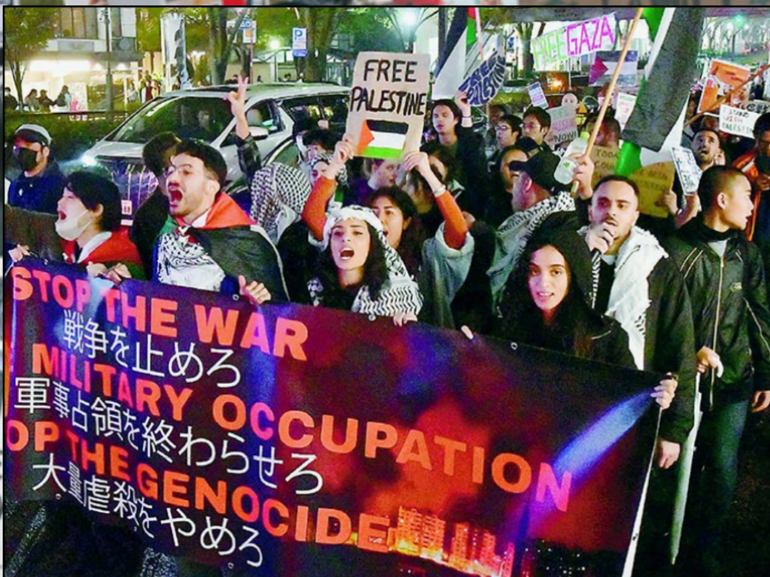
「攻撃の即時中止を」「虐殺をやめろ」と声を上げる人々＝10日、東京都内