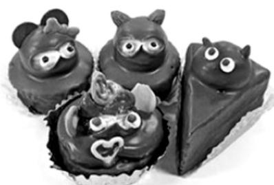
しんぶん赤旗 3月6日付

が、生クリームを使ったケーキが主流になるにつれ減少しました。▽…近年、かわいさや懐かしさから人気が再燃。インスタグラム上で「#たぬきケーキ」とハッシュタグが付けられた投稿は2万件を超え、販売を再開する店もあります。