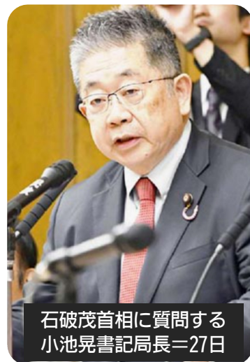
石破茂首相に質問する 小池晃書記局長＝27日

日本共産党の小池晃書記局長は3月27日、参院財政金融委員会で、石破茂首相が来年度予算成立後に「強力な物価高対策を打ち出す」と述べたことについて、消費税の5%減税とインボイスの廃止ことが最も強力な物価高対策だと迫りました。小池氏は、共産党が全国で取り組む要求アンケートに、党本部だけで1万通を超える回答が寄せられ、「不安が多く、ゆとりもない」が多く、政治の課題では「税金の集め方、使い方」が63%だと紹介。共通しているのは物価高に対する悲鳴で、消費税減税を求める声が多いと指摘しました。