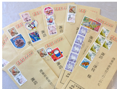
地域後援会の取り組みへの返信