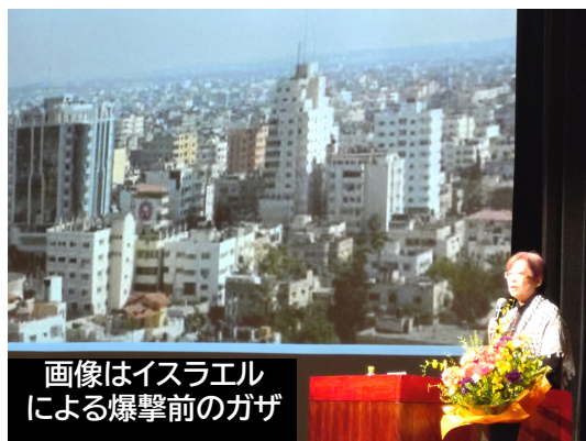
画像はイスラエルによる爆撃前のガザ

ガザで起きているジェノサイドに対して、「私たちは何を变えることができたか」を考えさせるものでした。事実を知ることから始まる。戦争をなくすためには声をあげ仲間を増やしていくことが重要であると改めて考える講演会でした。